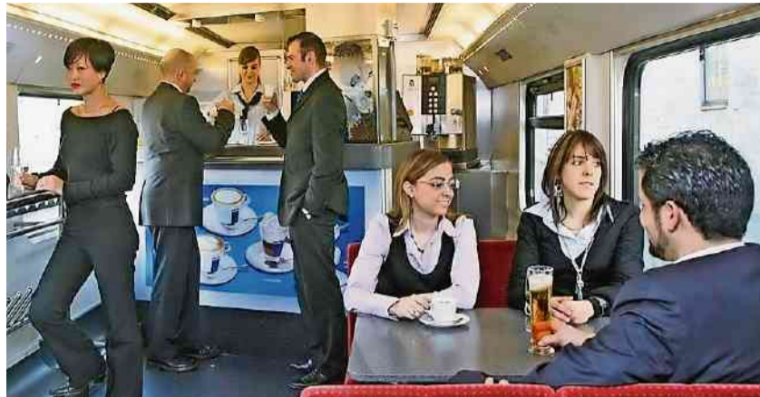
In den Speisewagen der SBB gibts ab April neue Biersorten.

Neben den regionalen Bierspezialitäten haben die SBB zudem Lieferan-